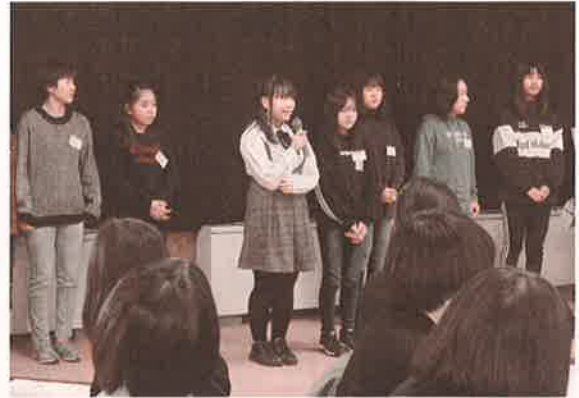
緊張しながらも、堂々とした発表でした。

令和2年1月25日(土)に「福祉教育・ボランティア活動実践発表交流会」が開催され、山形県内小学校や高校の生徒や先生、社協職員、ボランティア団体など150名が参加する中、宮内ぴよっこが実践発表を行いました。日ごろ取り組んでいるボランティア活動を発表し、その後福祉施設訪問時に行なう歌やダンスを披露しました。参加者より「人のためにみんなで楽しみながらボランティア活動をしていることは素晴らしい。」「子どもの姿というのは、地域の人にとっては元気の源になると思う。」「小学生の頃からこのような活動をしていることは大人になってから大きな強みとなると思う。これからも頑張ってください。」などの温かい言葉をいただきました。他団体の活動発表や参加者同士の交流を通して今後ますます活発に取り組む、継続していきたいと思いました。