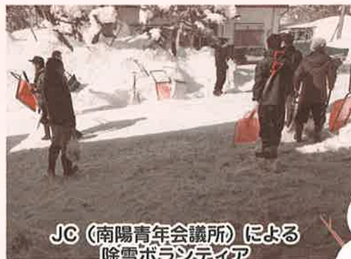
JC（南陽青年会議所）による 除雪ボランティア