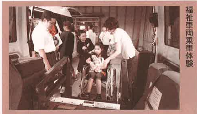
福祉車両乗車体験

うに手伝ってあげたい。」と感想を述べる子ども達もあり、心の成長につながりました。結びになりますが、今年度の活動にご協力いただきました、施設及び社協の方々へ心から感謝申し上げます。