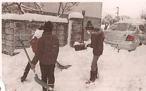
漆山小学校6年生による 高齢者宅訪問及び除雪ボランティア

JC（南陽青年会議所）や個人ボランティアの方々が高齢者世帯や障がい者世帯の除雪ボランティアを行いました。豪雪となったこの冬、大人の身長より積もった雪にボランティアさんも大活躍でした。また、漆山小学校6年生は高齢者宅に年賀状をお届けする活動で、今年は「実際に会って手渡しした方がいい。」という子ども達の希望がありお宅を訪問しました。短い時間でしたが除雪のお手伝いをしたり、お話ししたりと大変喜んでいただきました。