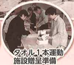
タオル1本運動 施設贈呈準備