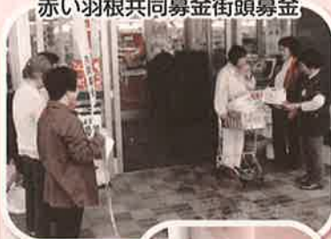
赤い羽根共同募金街頭募金