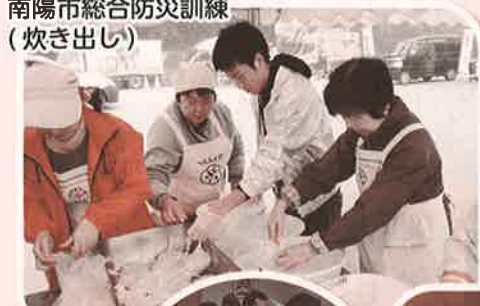
南陽市総合防災訓練 (炊き出し)