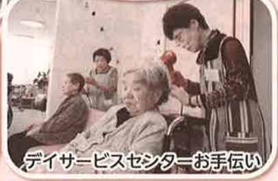
デイサービスセンターお手伝い

問合せ ボランティア友の会事務局(南陽市社会福祉協議会) ☎0238-43-5888