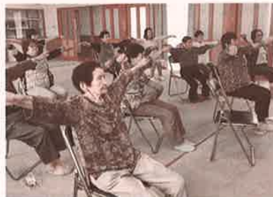
会場：中ノ目公民館