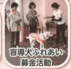
盲導犬ふれあい 募金活動