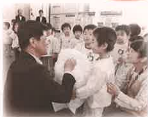
山形銀行宮内支店さんに ペットボトルキャップを 届けました