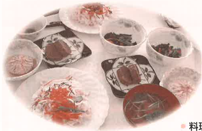
● 料理教室 ●