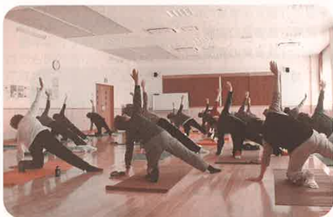
● 健康ヨーガ教室 ●