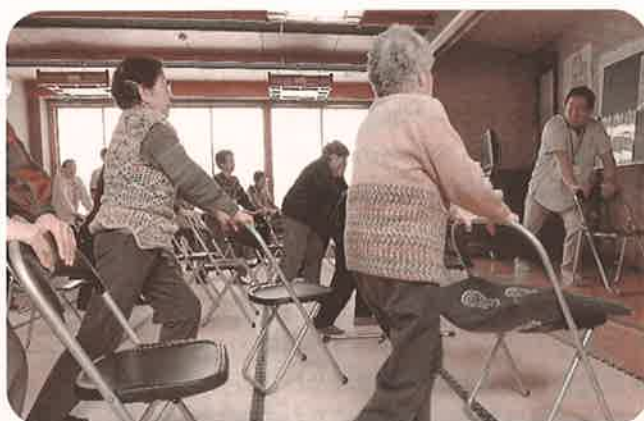
● てんとうむし(転倒予防教室) ●