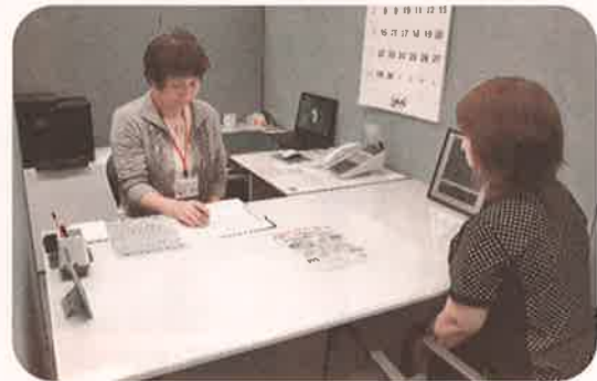
※生活自立支援センター、相談のイメージです。