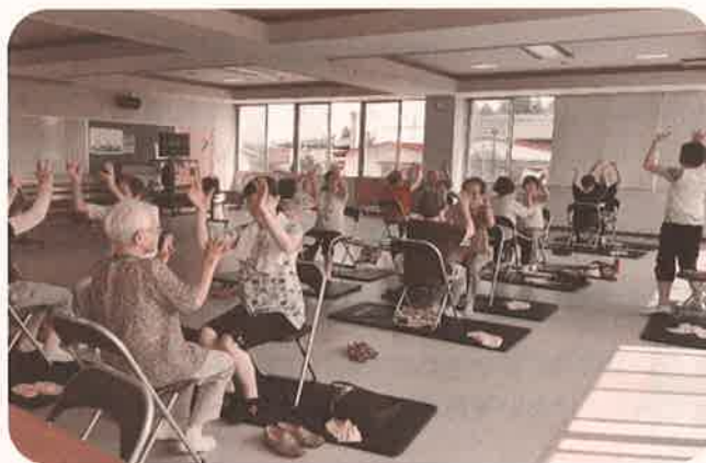
● 噛むCOME365(口腔機能向上プログラム) ●