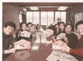
いこいの家にて干支飾り作り