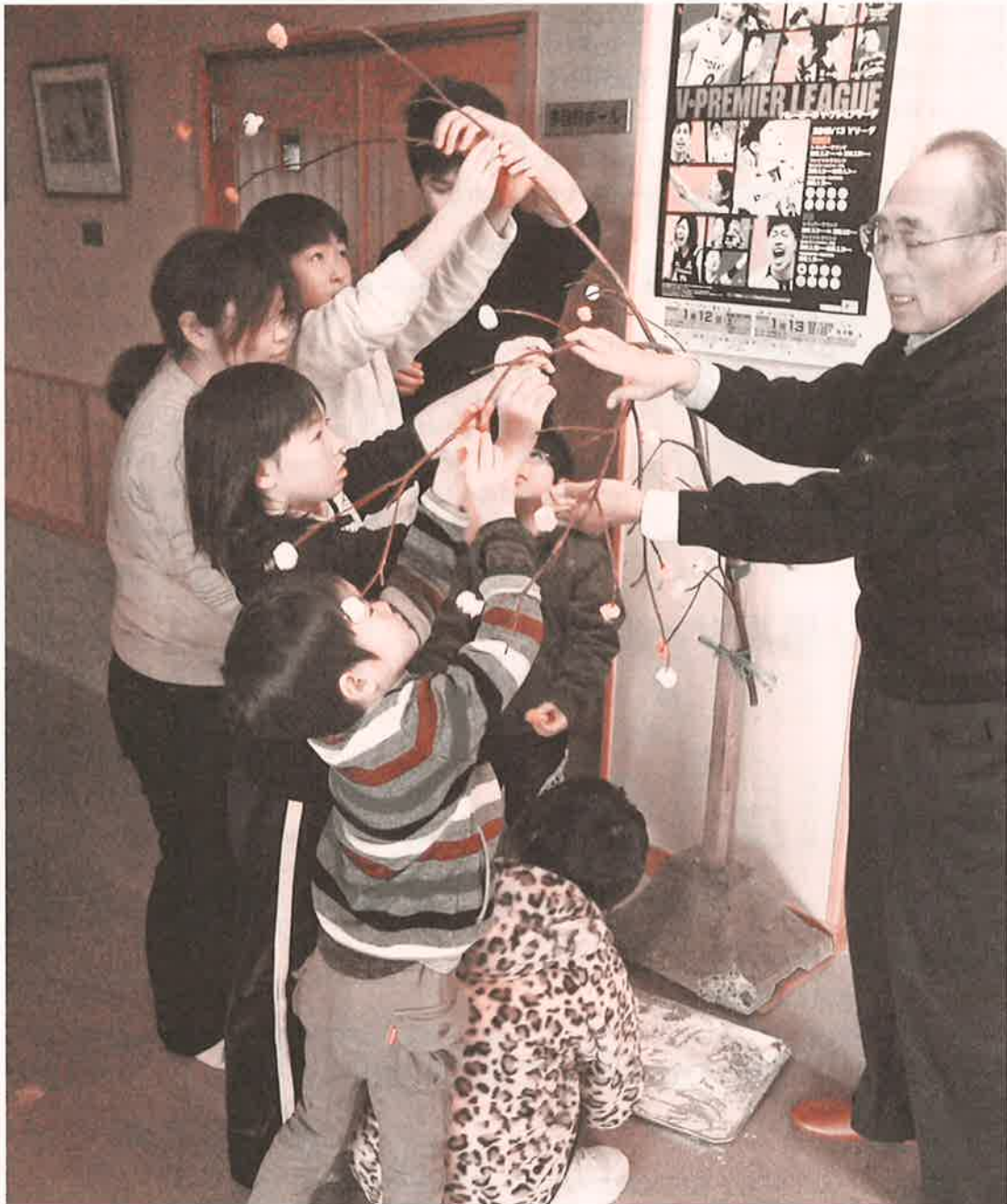
ぼらんていあひろばびよこ赤湯・宮内・沖郷合同 団子下げ