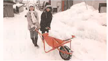
2月16日小学生ぼらんていあひろば「赤湯びよっこ」