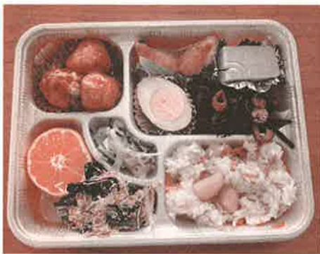
赤湯支部のお弁当

関係者の声…☆雪降る時におしよしな。 ☆楽しみに待っていました。 ☆肉屋さんからいただいた凍豆腐を煮物に入れてあります。温かいうちにどうぞ。 ☆美味しかったと社協支部にお礼の電話もいただきました。