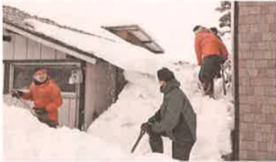
2月3日南陽市青年会議所