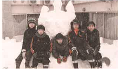
2月9日小学生ぼらんていあひろば「宮内びよっこ」